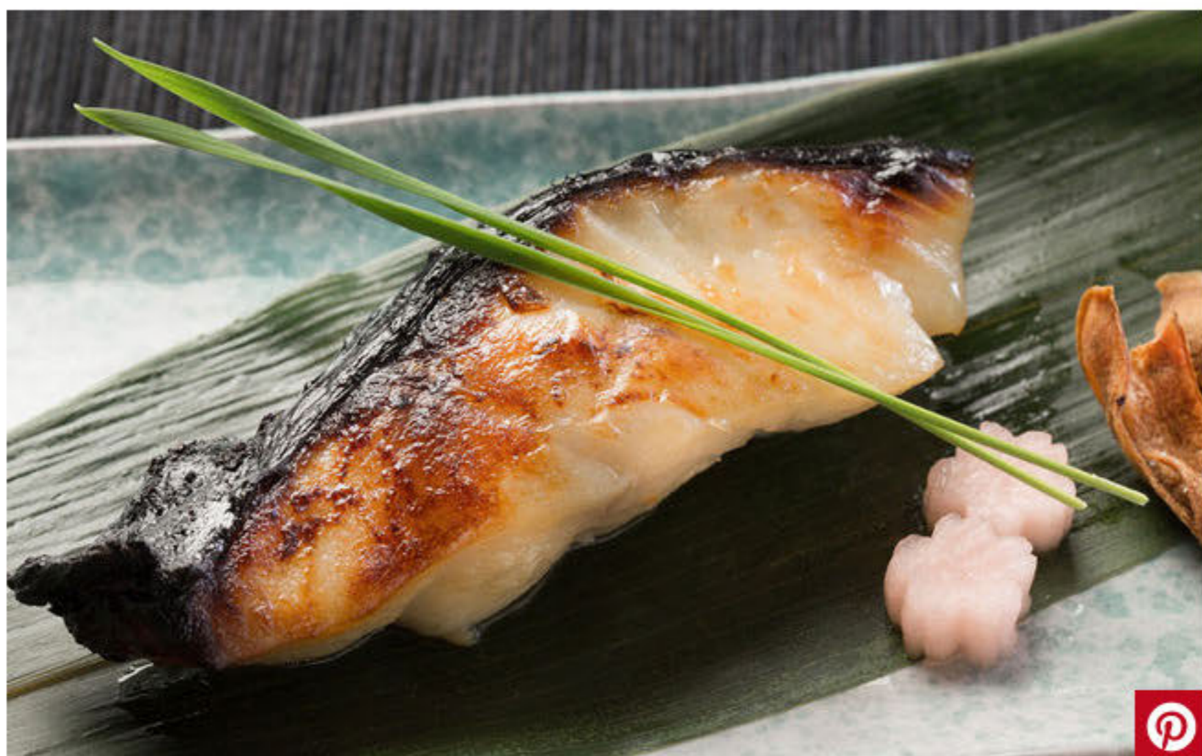
UNBEDINGT PROBIEREN: BLACK COD-FISCH IM ZENKICHI